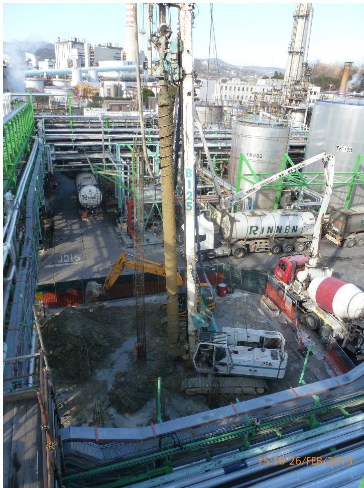
Costruzione nuova unità produttiva – Soc. Infineum – Vado I. (SV)

Nuovo fabbricato direzionale stabilimento Verallia – Dego (SV)