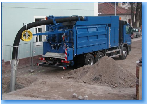
Scavi in presenza di sottoservizi