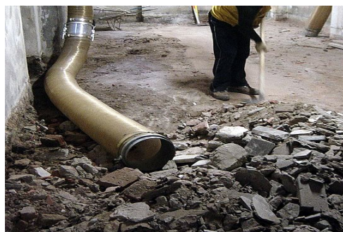
Rimozione calcinacci, detriti ecc.