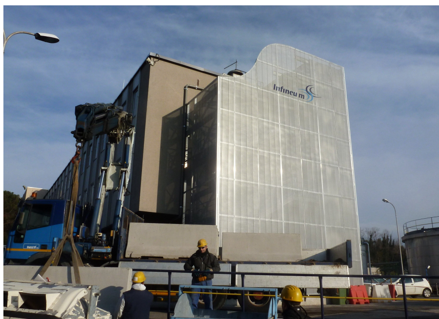
Struttura metallica per scala emergenza ed ascensore – Soc. infineum – Vado L. (SV)

INFINEUM ITALIA – rete interrata antincendio in resina isoftalica (vetroresina) - Lotti 2009-2010-2011 EXXON MOBIL-SHELL – Infineum Srl – impianti elettrici, trasmissione dati, idraulici, termici e condizionamento nuova palazzina uffici di stabilimento SAINT GOBAIN – Vetri Spa – impianto industriale antincendio di stabilimento AUTORITÀ PORTUALE – porto di Savona – impianti elettrici ed antincendio deposito multipiano CEMENTILCE SPA – Cemex group – impianti elettrici ed idraulici nuovo cementificio AQUARAMA RENT SPA – impianti elettrici, idraulici autolavaggio C.E.S.T.A. – impianti elettrici e gas di processo laboratorio chimico di stabilimento ASILO COMUNALE CAIRO M. (SV) – centrale termica, impianti elettrici e termoidraulici. COMUNE DI CAIRO M. (SV) – centrale termica, impianti elettrici e termoidraulici bocciofila comunale DIOMEDE Srl (SV) - impianti elettrici, termoidraulici, condizionamento fabbricato civile DEPOSITI COSTIERI MEDITERRANEI Impianti sbarco olii vegetali nel porto di Savona GIS Spa – Impianto elettrico e condizionamento struttura residenziale – 70 unità abitative - Andora(SV)