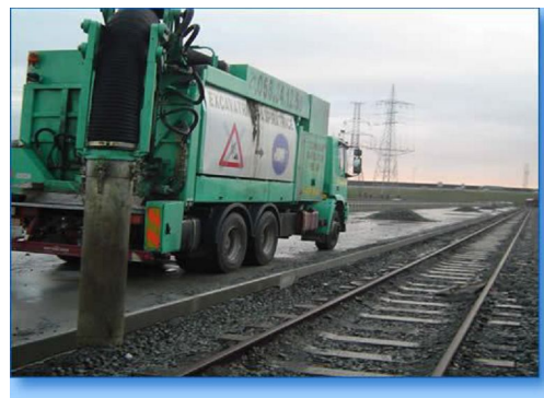
Lavori su massicciata ferroviaria