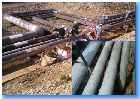
Lavori sotto tubazioni