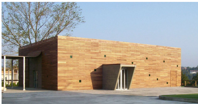
Show room Soc. Verallia – Dego (SV)

Rifacimento centro urbano Frazione Marta (SV) –COMUNE VILLANOVA D'ALBENGA